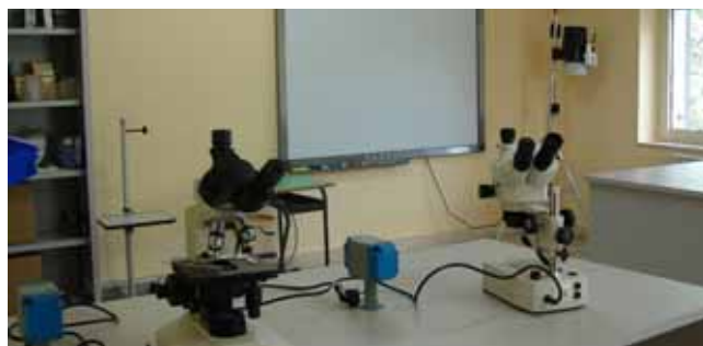
Laboratorio Scientifico B-1.A-FESR06_POR_CAMPANIA-2011-196

I finanziamenti previsti dal Fondo Europeo di Sviluppo Regionale nell'ambito del Piano Operativo Regionale Campania hanno consentito alla nostra scuola di dotarsi di nuovi ed efficienti Laboratori per promuovere la Società dell'informazione e della conoscenza.