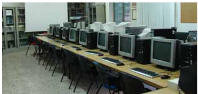
Laboratorio Multimediale A-1-FESR06_POR_CAMPANIA-2011-305