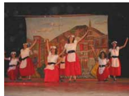
“Masaniello” Premiato alla Rassegna “Pulcinellamente”