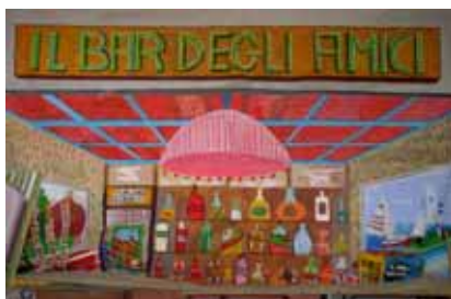
“ Il coraggio di ricominciare” Premiato dalla Regione Campania

Il cinema, il teatro, lo studio dello strumento musicale negli ultimi anni hanno riscosso notevoli consensi sia tra gli alunni e genitori, sia sul territorio. L'iter dei progetti, documentato puntualmente da DVD con musiche, foto e filmati, ha trovato conclusione in produzioni presentate nell'auditorium di Caivano Arte.