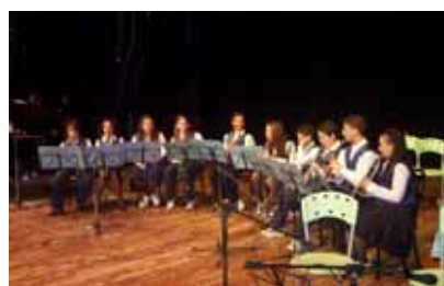
“Concerto di fine anno” Teatro Caivano Arte Pianoforte, clarinetto e chitarra classica