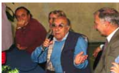
"Seconda classe si scende". Film con la partecipazione straordinaria di Enzo Cannavale . Trasmesso su Rai 2 nel programma Screen Saver. Premiato al concorso "Diamoci una mano" promosso da Telefono azzurro Regia: Gregorio Mascolo