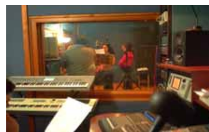
Incisione di un CD musicale realizzato in una sala di registrazione professionale