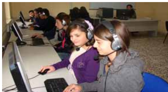
Laboratorio Linguistico B-1.B-FESR06_POR_CAMPANIA-2011-236