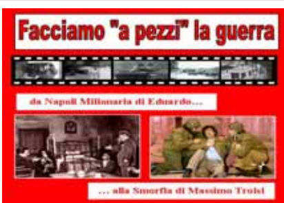
“ Facciamo a pezzi la guerra” Spettacolo teatrale