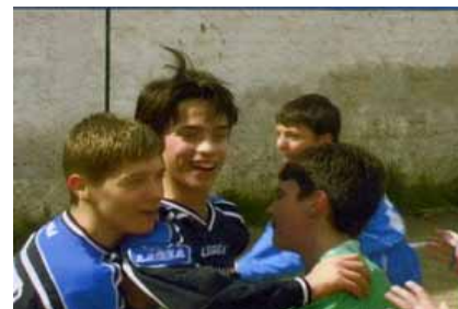
"La maglietta numero 11" Film Premiato al Concorso sulla Legalità "Peppino Impastato" Regia: Gregorio Mascolo