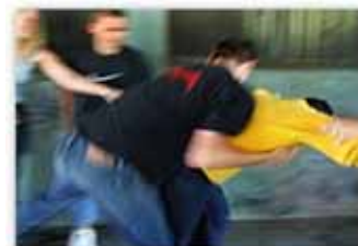
"Tutti insieme: No al Bullismo" Cortometraggio realizzato nell'ambito del Progetto sulla Legalità Regia: Gregorio Mascolo