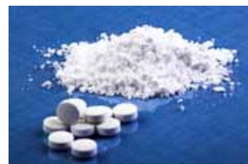
"Droga? S.O.S Astolfo" Questo il titolo del nono cortometraggio realizzato dalla nostra scuola. Regia: Gregorio Mascolo