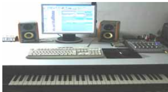
Laboratorio Musicale B-1.C-FESR06_POR_CAMPANIA-2011-225