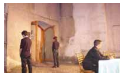
“Teatro a Corte” Rappresentazione teatrale realizzata nel Castello Medievale di Caivano nell'ambito dei Progetti PON 2007-2008