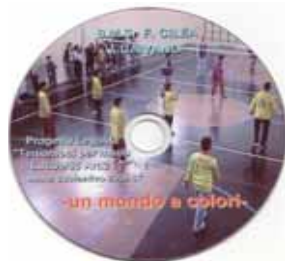
"Un mondo a colori" Cortometraggio realizzato nell'ambito del Progetto sulla Legalità Regia: Gregorio Mascolo