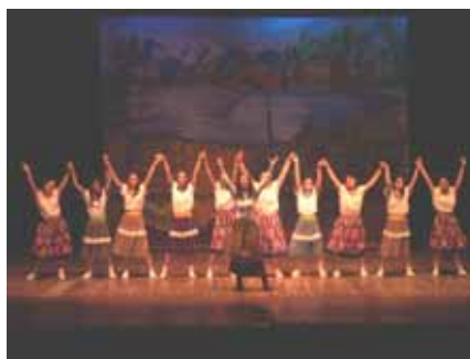
“Tutti insieme appassionatamente” Spettacolo teatrale